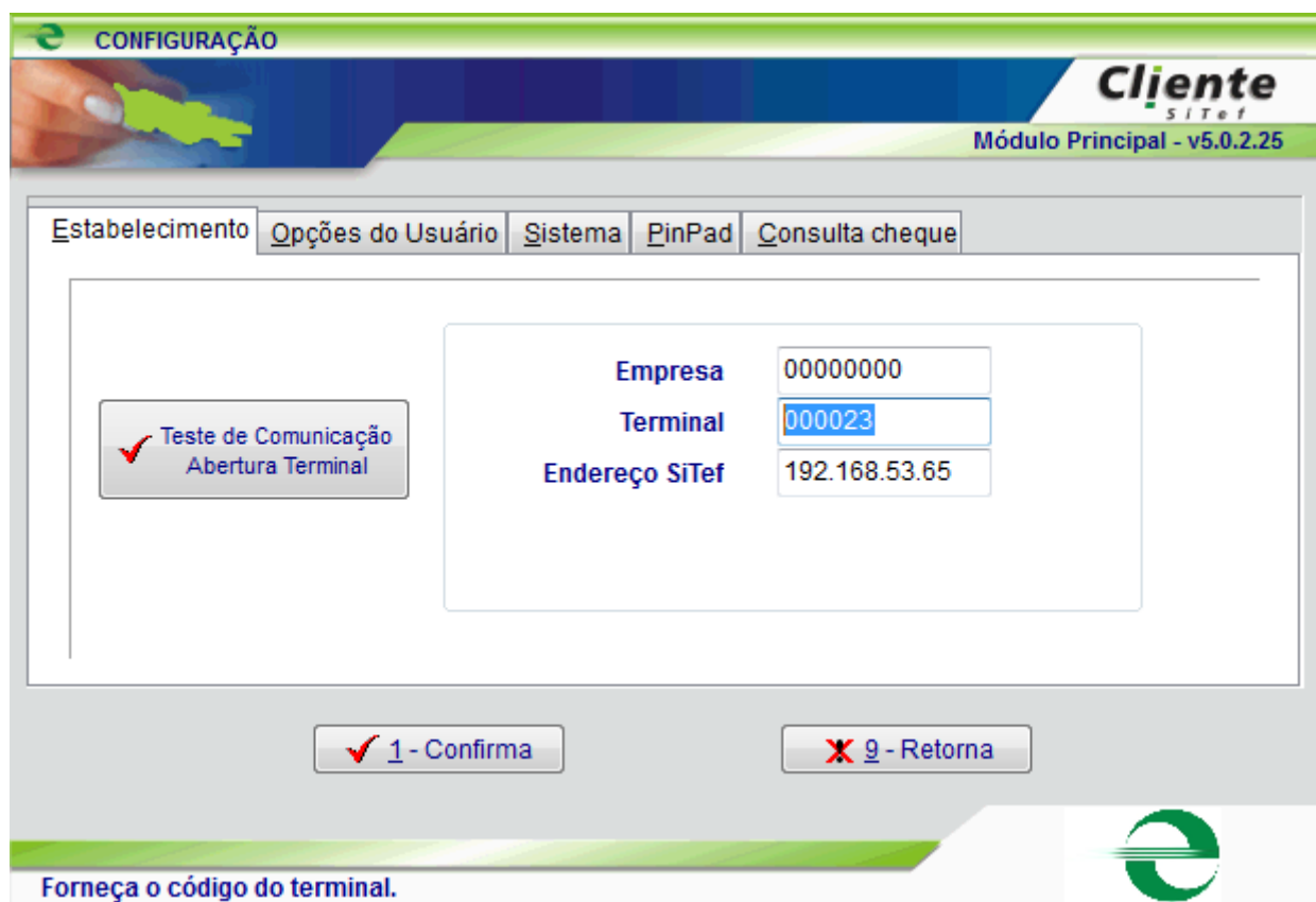
Figura 1: Tela de configurações do Client Modular

Existe uma configuração no Client Modular (número do terminal) que identifica o PDV perante a loja (empresa). Ela é acessada pelo PDV através do header ADM, botão Configurações, Guia Estabelecimento (conforme tela abaixo). Possui o formato XXnnnnnn onde XX corresponde a 2 caracteres alfabéticos (no caso do Client Modular é fixo em SW e desta forma não aparece para ser configurado) e nnnnnn 6 dígitos quaisquer desde que o número resultante não sobreponha a faixa 000900 a 000999 que é reservada para uso pelo SiTef.